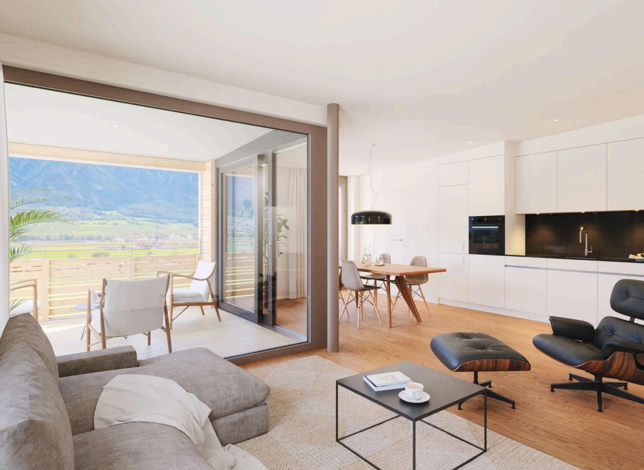
Visualisierung Haus B, 2.5-Zimmer-Wohnung